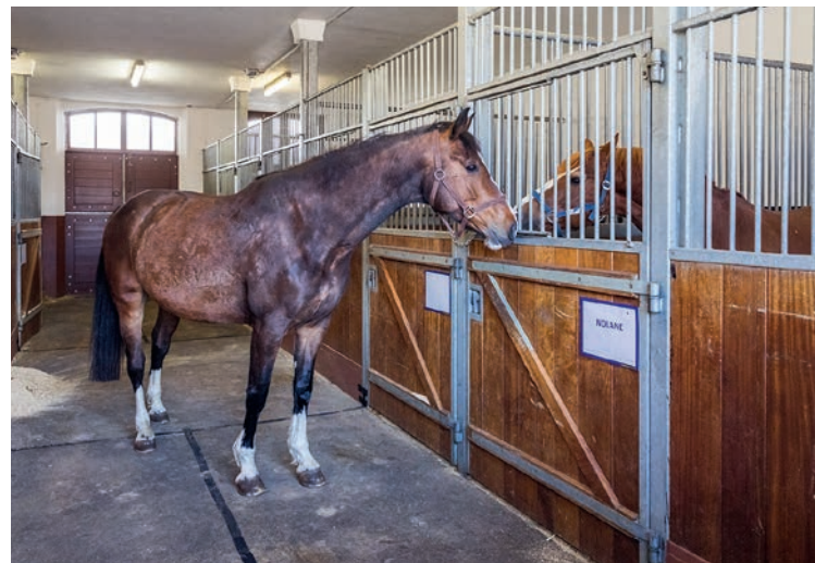
La jument Athéna (à gauche) se déplace librement dans l'écurie pour choisir son étalon préféré. Elle intégrera ensuite son « harem ».

Le CMH peut donc influencer la manière dont les partenaires se choisissent, mais pas seulement. Les récents travaux prouvent,