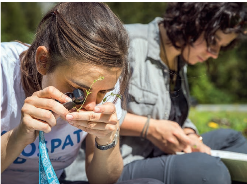
Définir l'espèce exacte n'est pas toujours tâche aisée.

bien que moins prononcée, a été constatée en altitude. « Nous pensons qu'il s'agit là d'une conséquence du réchauffement climatique. Les stocks de carbone augmentent car des régions hautes, devenues plus favorables, accueillent des plantes qui ne s'y trouvaient pas auparavant. »