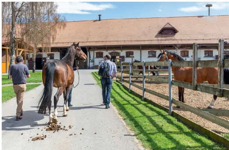
Les recherches sont menées sur des chevaux de la race des Franches-Montagnes du Haras national suisse à Avenches.

gestation le choix a lieu. Selon eux, ce contrôle maternel sur la reproduction, observé chez les chevaux, pourrait s'appliquer à d'autres mammifères, y compris l'homme.