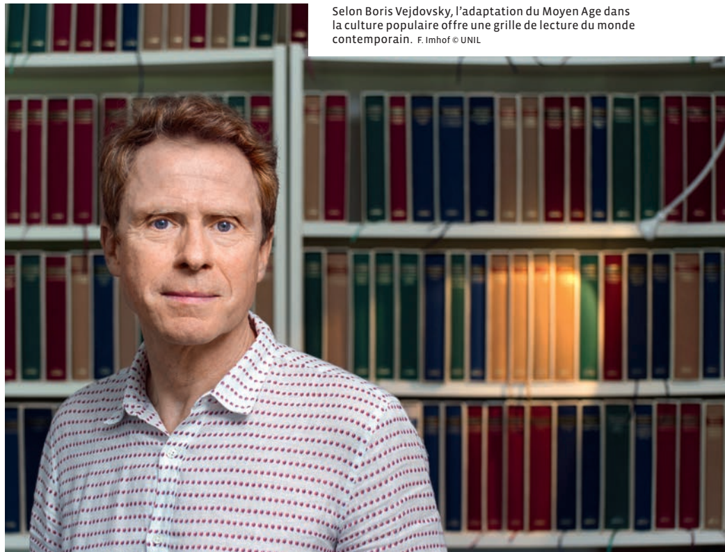
Selon Boris Vejdovsky, l'adaptation du Moyen Age dans la culture populaire offre une grille de lecture du monde contemporain.