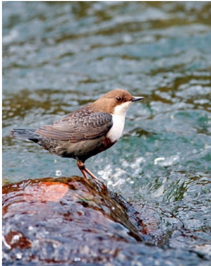
D. Salvatore © UNIL

PROFITEZ DE L'ÉTÉ POUR SILLONNER DORIGNY LE NEZ EN L'AIR ET SIGNALER LES OISEAUX que vous observez via la plateforme de la Station ornithologique suisse ornitho.ch ou l'application NaturaList (disponible sur Android uniquement). Les données récoltées serviront à enrichir un inventaire de la biodiversité du campus mené par des biologistes du Département d'écologie et évolution.