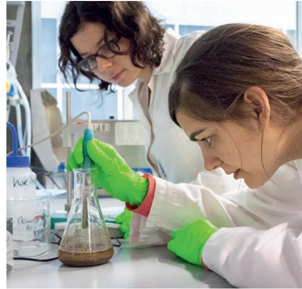
L'analyse du pH (acidité) d'un échantillon de terre est réalisée dans les laboratoires du Géopolis.