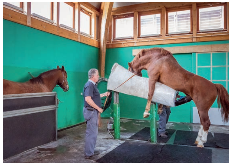
La présence d'une jument « animatrice » influence la qualité et la quantité de sperme dans l'éjaculat du mâle.