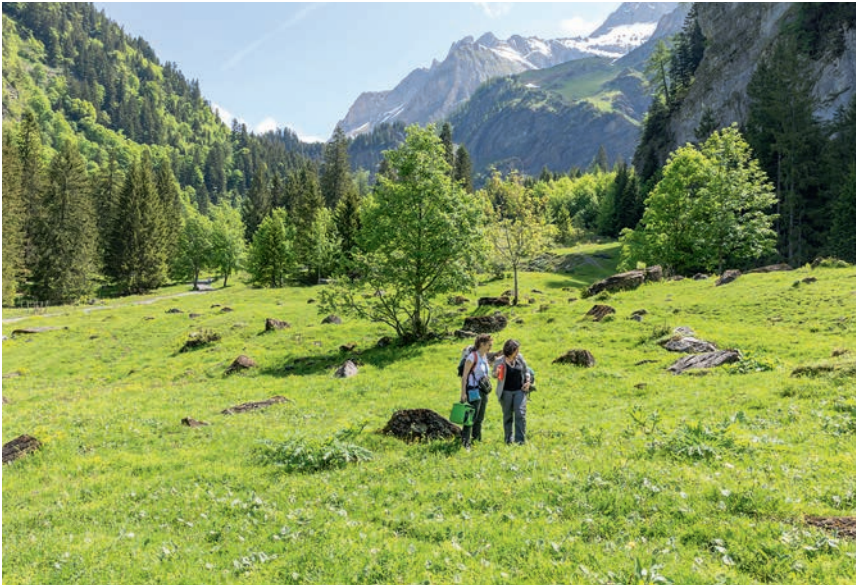
Les chercheuses, ici dans le vallon de Nant, réalisent des inventaires floristiques dans toutes les Alpes vaudoises.