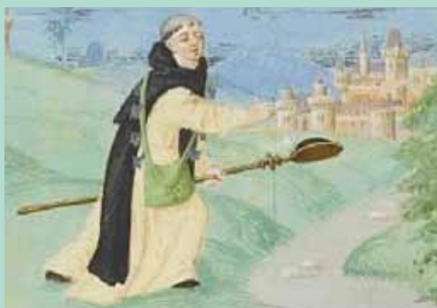
Manuscrits du Pèlerinage de vie Humaine de Degulleville

Le Centre d'études médiévales et postmédiévales de l'UNIL invite le public à venir assister à une série de conférences publiques tous les jeudis du 23 février au 29 mars 2012 de 18h à 19h à la salle du Sénat du palais de Rumine.