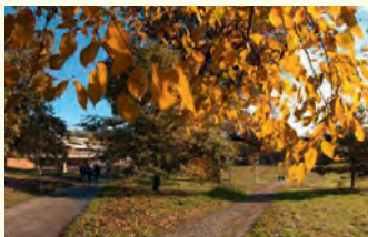
S. Prada © UNIL

Maurice Olender (EHESS, Paris). Les langues du paradis: entre éloges et fables savantes. Conférence en ouverture du colloque international de la Société suisse pour la science des religions les 11 et 12 novembre. Château, 106-8 voir encadré ci-dessous