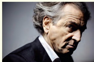
© Olivier Roller, portrait de Bernard-Henry Lévy, 2010