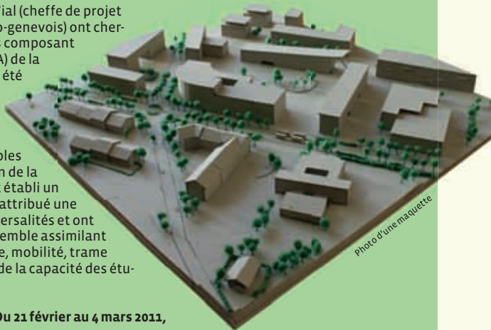
photo d'une maquette

Exposition des travaux d'étudiants de Master en études urbaines 2009-2011, en collaboration avec l'Observatoire de la ville et du Développement durable (IGUL).