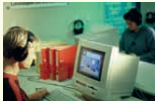
Travaux pratiques au Centre de langues, UNIL

Inscrivez-vous depuis notre site: www.unil.ch/cdl