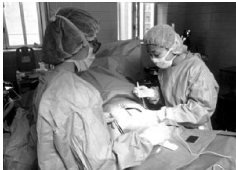
Au-delà de l'acte chirurgical, un patient dont l'identité est menacée...

Il est réducteur de penser que le cœur est une simple pompe, son importance existentielle n'est pas réduite à cela. Ici, on touche à une question fondamentale: qu'est-ce qui fait l'individu?