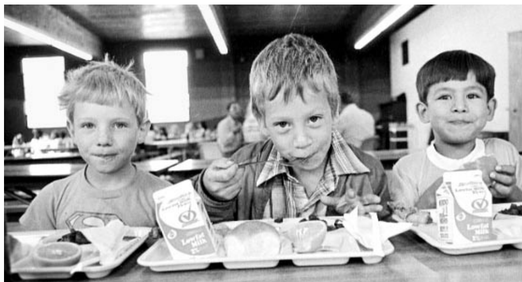
L'avaleur n'attend pas le nombre des années.

Prochaines conférences: 4, 11 et 18 février