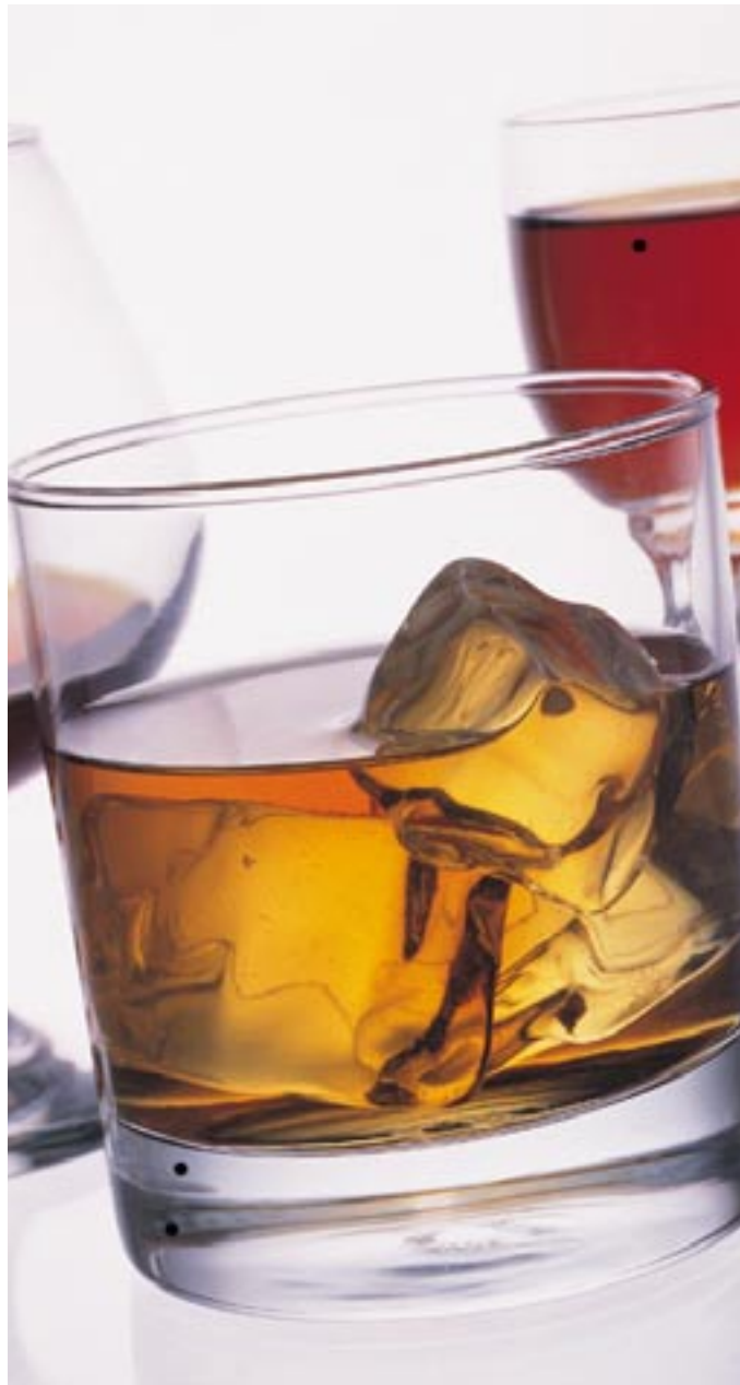
A consommer avec modération...

L'intervention thérapeutique brève s'adresse notamment à ce groupe-là, c'est-à-dire des personnes qui dépassent le seuil d'une consommation raisonnable d'alcool sans pour autant être atteintes d'alcoolisme. Pour les hommes, ce seuil est fixé à deux à trois verres d'alcool par jour, ou pas plus de 5 verres lors d'occasions pon-