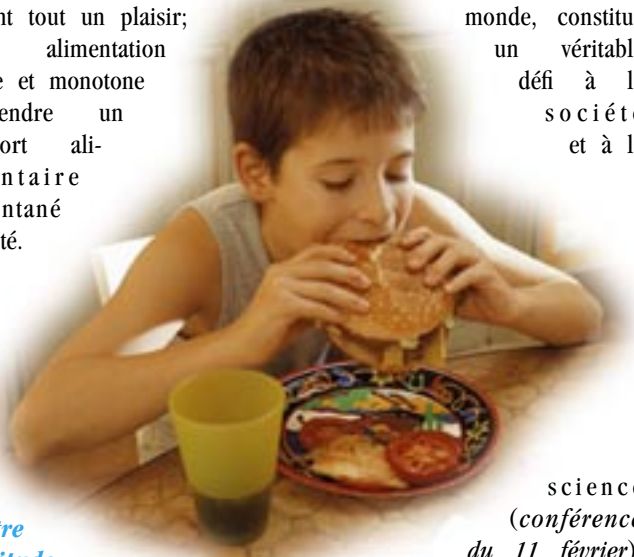
science ( conférence du 11 février ).

Les troubles du comportement alimentaire (anorexie, boulimie, grignotages compulsifs), dont la prévalence devient de plus en plus élevée dans le monde, constitue un véritable défi à la société et à la