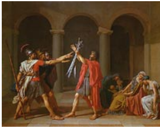
«Le serment des Horaces», toile de Louis David. Les trois Horaces jurant de vaincre ou de mourir.