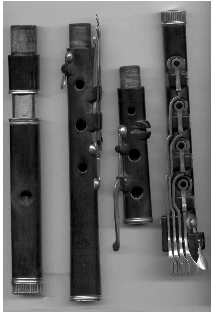
La flûte dans tous ses états, du piccolo à la subcontrebasse, flirte avec l'électronique dans un concert expérimental en quadriphonie.

Programme complet et renseignements: 021 329 02 82 / smclausanne@bluewin.ch