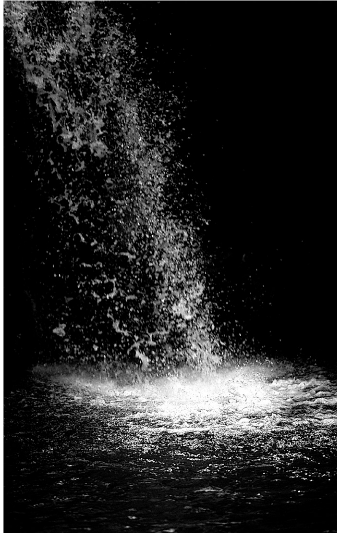
Philtres d'amour, stimulants sexuels... les aphrodisiaques ont traversé l'histoire de l'humanité, comme la légende d'Aphrodite, née de l'écume de mer.

«Les aphrodisiaques, substances qui augmentent le désir n'existent simplement pas», explique Jacques Diezi. Mais autour de ces pseudo-stimulants sexuels est apparue toute une catégorie de «médicaments détournés», qui accompagnent l'histoire de la pharmacologie et sont utilisés pour répondre aux grandes préoccupations de l'es-