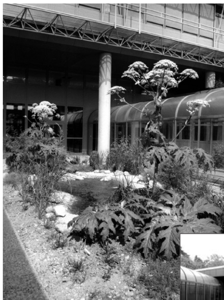
Ci-contre: l'étang et son biotope. Ci-dessous: l'aménagement actuel du patio du Bâtiment de biologie.