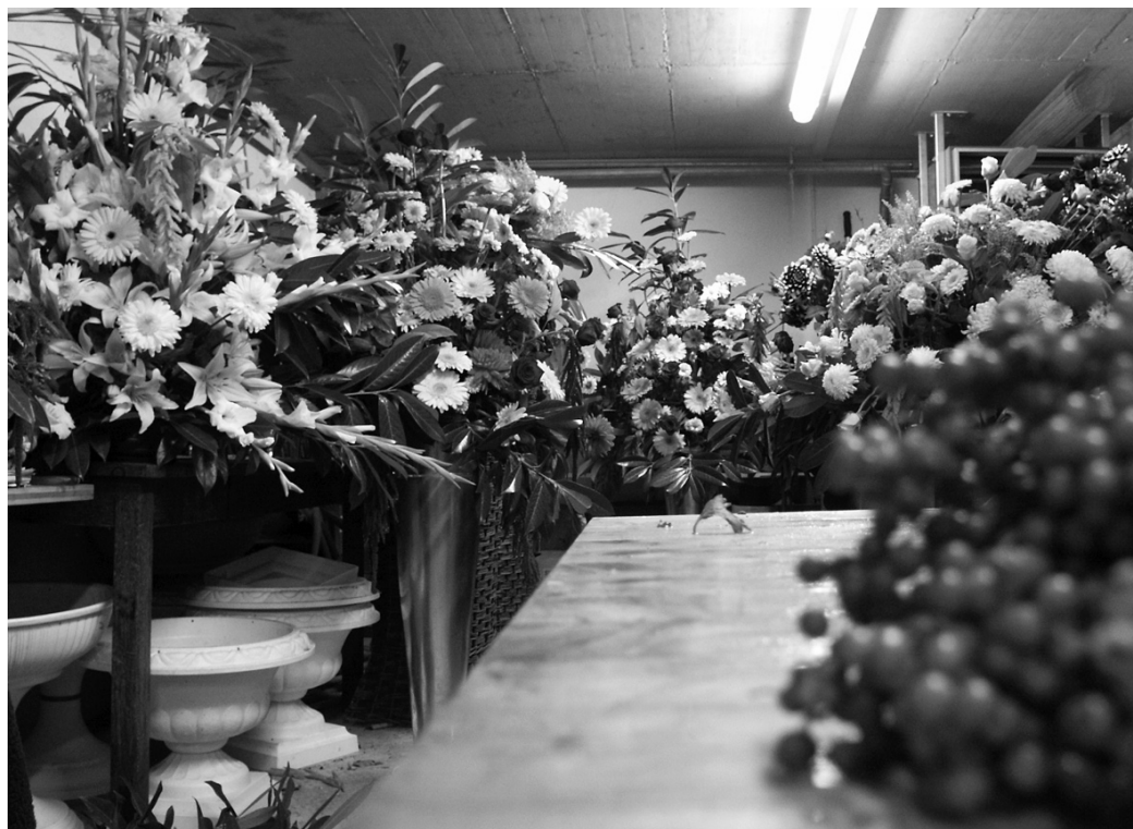
Ferme de la Mouline, à deux jours du Dies Academicus. 400 lys par an, un millier de glaïeuls, 15 variétés de dahlias... des milliers de fleurs sont produites chaque année sur le site de Dorigny.

Quelques jours avant le Dies Academicus et la journée Jean-Monnet, la ferme de la Mouline se transforme en atelier de fleuriste. En attendant la visite de la fine fleur de l'Université et d'ailleurs, les jardiniers s'exercent à l'art difficile de l'arrangement floral. Plus de 500 fleurs seront passées entre leurs mains pour les seules festivités du week-end dernier. Pour Jean Monnet, les fleurs seront jaunes, couleur «étoiles européennes». Pour le Dies Academicus, le mélange sera à l'honneur: blanc, violet, rouge et orange.