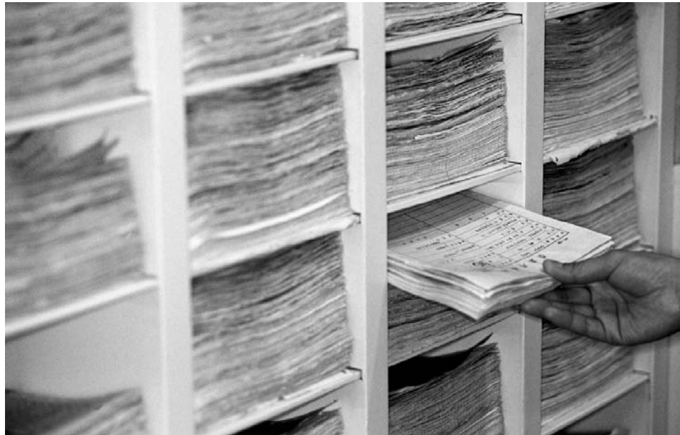
Le « casier » virtuel que le centre informatique met à disposition de chaque membre de l'UNIL permet de stocker en toute sécurité ou de partager l'équivalent d'un zip plein (250 mb).

Dans le cadre du développement des services Internetunil destinés aux étudiants de l'UNIL, une enquête a été menée en mai 2000 auprès des utilisateurs de ces services (près de 3'000 à l'époque). Trois quarts des