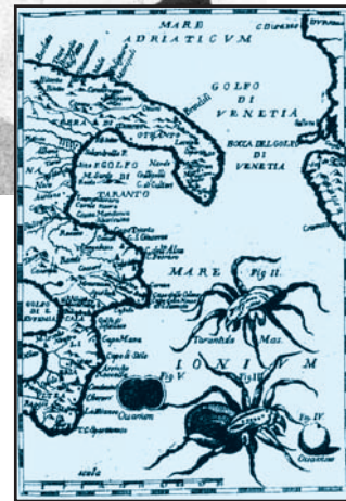
Carte géographique de l'Opera omnia de G. Baglivi, édition vénitienne de 1754