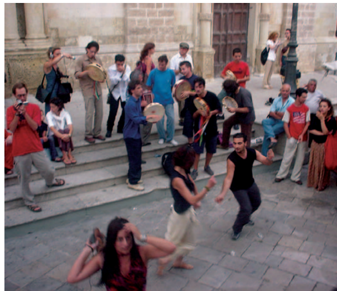
Galatina (LE), aube du 29 juin 2002. Jeunes «célébrants» et «curieux» le jour du pèlerinage de «St.Paul-des-tarentules» sur le parvis de la cathédrale. G. Di Mitri

Elle devient, en gros, un emblème d'appartenance ethnique pour les uns (notamment chez les jeunes méridionaux), un genre musical et une danse «exotique» pour les autres. Or, cet intérêt inattendu et abondamment médiatisé contribue à la naissance d'un ferment identitaire. Ancré dans un discours actuel magnifiant le Sud et le Salento, l'univers symbolique et musical du tarentisme s'exporte désormais comme un label «alternatif», répondant à nos désirs d'Occidentaux en mal d'«authentique» et d'«exotique». En plus de remédier à une certaine perte de repères des jeunes, le mythe revivifie le rapport des émigrés à leurs racines. Il rachète par son succès grandissant – du moins celui de la tarentelle – le «complexe d'infériorité» vécu par les habitants du Mezzogiorno: en bref, il contribue à (re)construire une «mémoire ethnique» chez les Salentins.