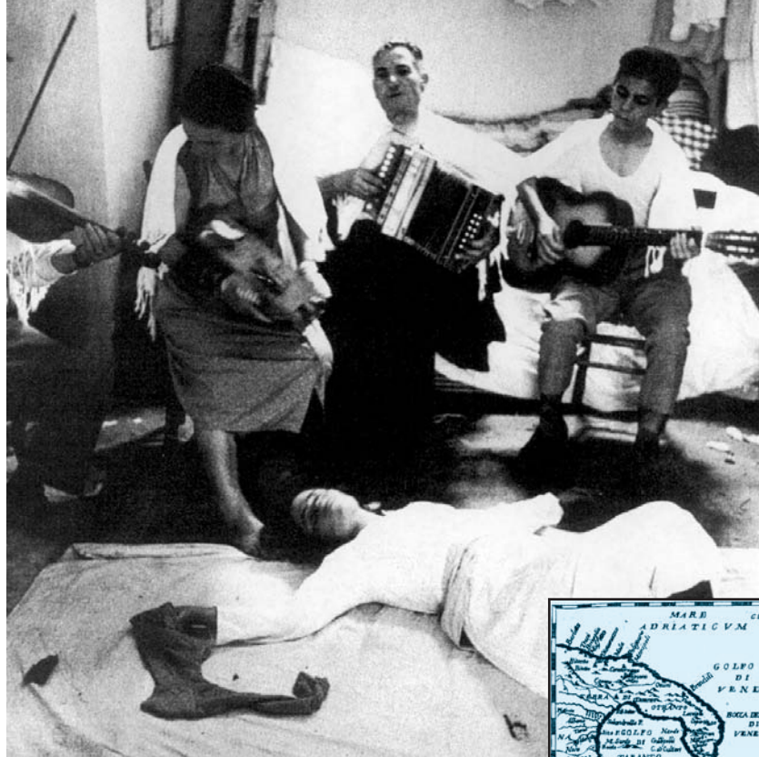
« Rite domiciliaire » du tarentisme: phase « mimétique » (identification à l'araignée) de la musicothérapie effectuée au domicile de la possédée, observée par E. De Martino (Nardò 1959)