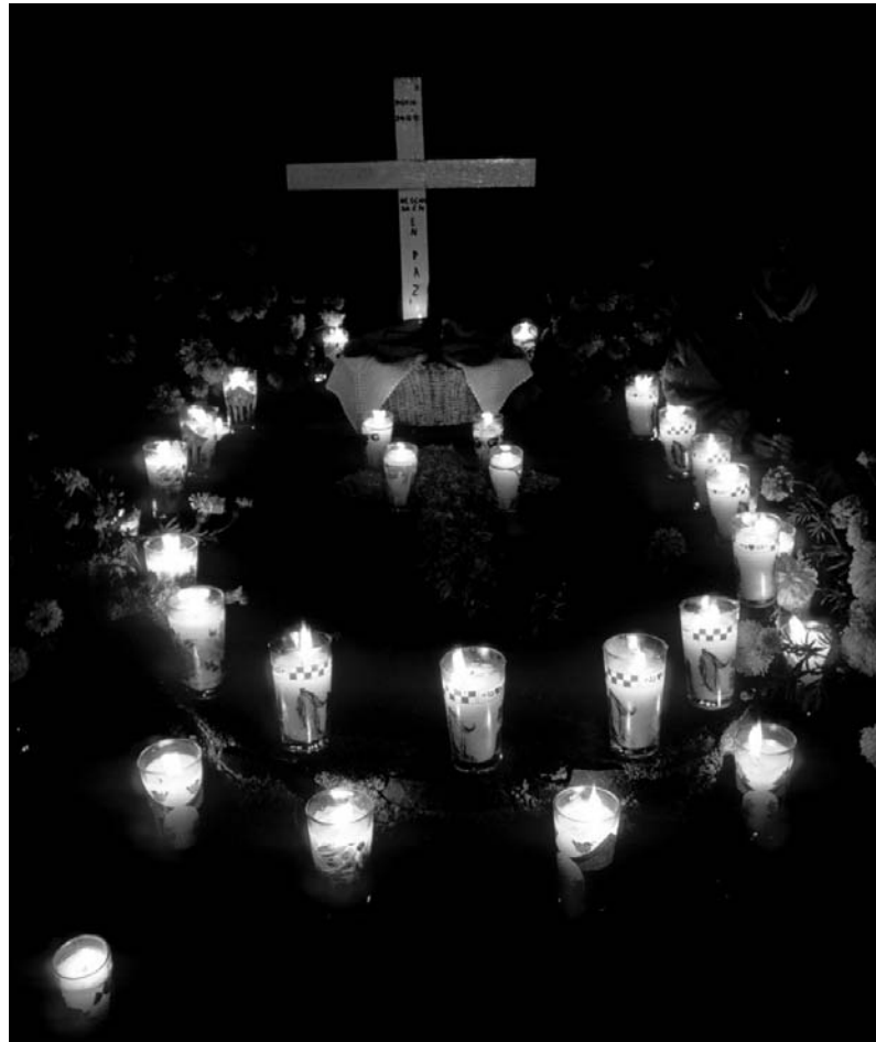
Zone de «non-savoir», la mort et ses représentations est un champ religieux largement exploité.

L'année passée déjà, la Faculté de théologie s'était attaquée à cette thématique, dans le cadre d'un séminaire de formation continue. Le succès remporté avait alors forcé les organisateurs à refuser de nombreux candidats et le Cours public a été mis sur pied, pour répondre aux fortes deman-