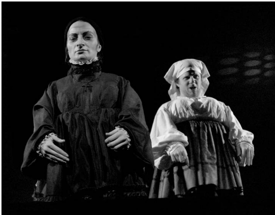
La Maison de Bernarda Alba, une création d'Andrea Novicov inaugurée à la Grange qui suit son chemin. A suivre en janvier prochain au théâtre Saint-Gervais à Genève.

La saison 2002-2003 du théâtre de la Grange s'est achevée sur un franc succès avec un taux de fréquentation record. Les lendemains s'annoncent donc chan-