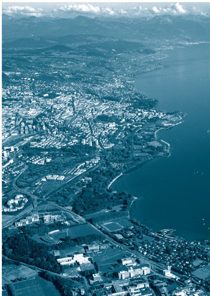
Deux nouvelles facultés: valoriser une tradition scientifique lémanique.

Les plates-formes dans le domaine de l'imagerie médicale