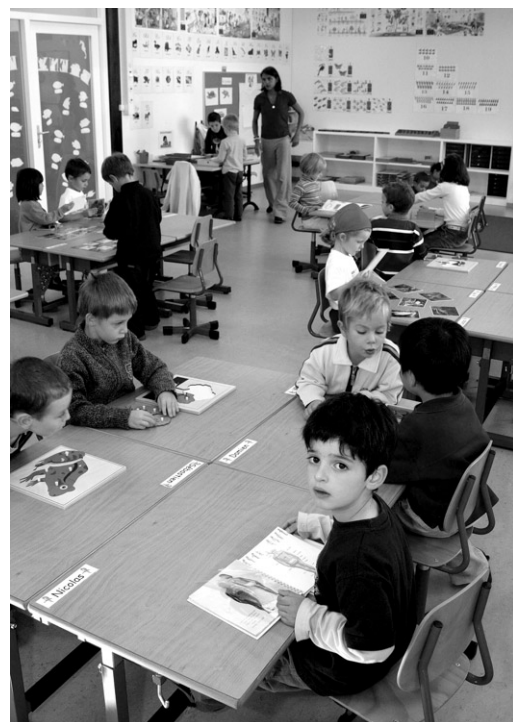
Ces bambins font leur toute première rentrée... sur un campus!