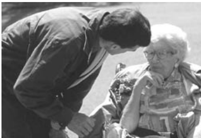
Cours et mandats sensibilisent les étudiants aux problématiques du vieillissement en les confrontant à des situations de terrain.

relais entre l'Université et les institutions impliquées dans l'action auprès des personnes âgées.