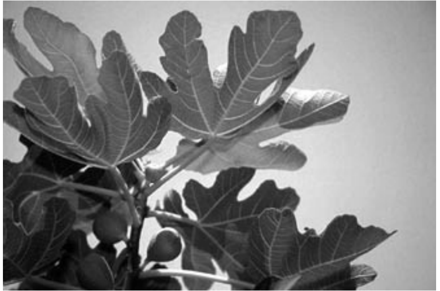
Un figuier, en harmonie avec ses hôtes