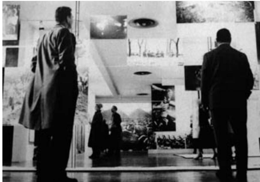
Family of man, ou l'apologie des Nations-Unies servie par l'idée d'une photographie humaniste. New York, 1955.