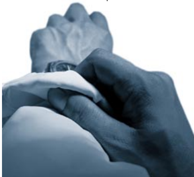
Diplôme en poche, le travail ne fait que commencer.

L'entrée dans le monde professionnel est évidemment soumise aux aléas de la conjoncture. La morosité économique actuelle