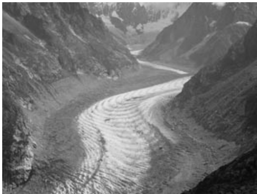
Glacier de la Mer de Glace, rive gauche de la Vallée de l'Arve.

Quelques collectivités alpines commencent d'ailleurs à y être sensibles. Voyant leurs revenus parfois durement touchés par des hivers de moins en moins rigoureux, elles pensent à d'autres moyens pour valoriser leur patrimoine naturel. Ainsi est né le géotourisme, qui fait l'objet d'un cycle de conférences organisé par ArGiLe, l'Association des géographes de l'UNIL. Cette remise en cause du tourisme «intensif» au profit d'une approche plus respectueuse de l'environnement est une aubaine pour les chercheurs en Sciences de la Terre. Plusieurs scientifiques de l'Institut de géographie de l'UNIL