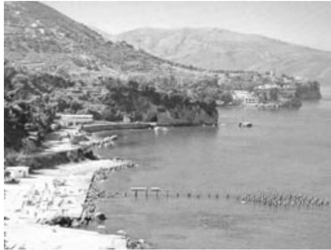
La côte albanaise laisse entrevoir un petit pays montagneux.