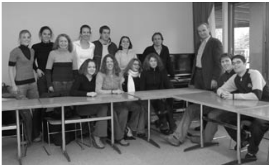
Douze élèves zofingiens et deux professeurs de français réunis autour de leur Stammtisch.

tonschule de Zofingen, qui a étudié à Lausanne il y a une trentaine d'années. L'Université était encore sise à la Cité et la vie qui y régnait a marqué durablement la mémoire du professeur. C'est donc un appel du cœur autant que de la raison qui a motivé le professeur