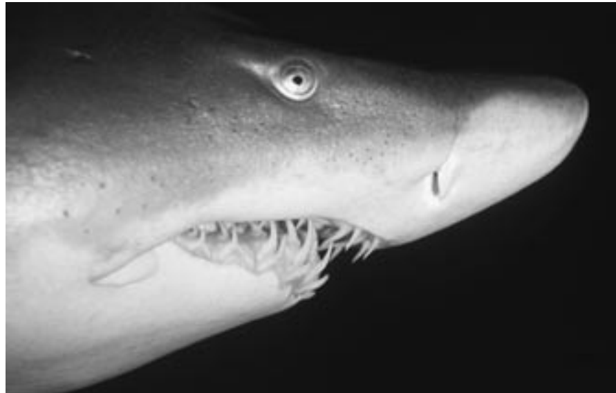
Les dents de requins racontent le climat.

plexes sont pourtant maintenant à portée de la compréhension humaine, notamment grâce à l'étude des isotopes stables. En effet, la plupart des éléments ont des isotopes. C'est-à-dire que pour un élément tel l'hydrogène par exemple, la masse volumique change en fonction du nombre de neutron du noyau.