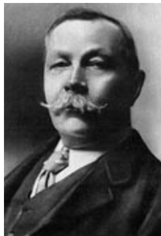
Sir Arthur Conan Doyle

Le manuscrit de L'aventure de Shoscombe Abbey vient d'être édité sous forme de fac-similé par la Bibliothèque cantonale universitaire avec le concours de la Société d'études Holmeiennes de Suisse romande, club littéraire local dédié à l'exégèse du maître.