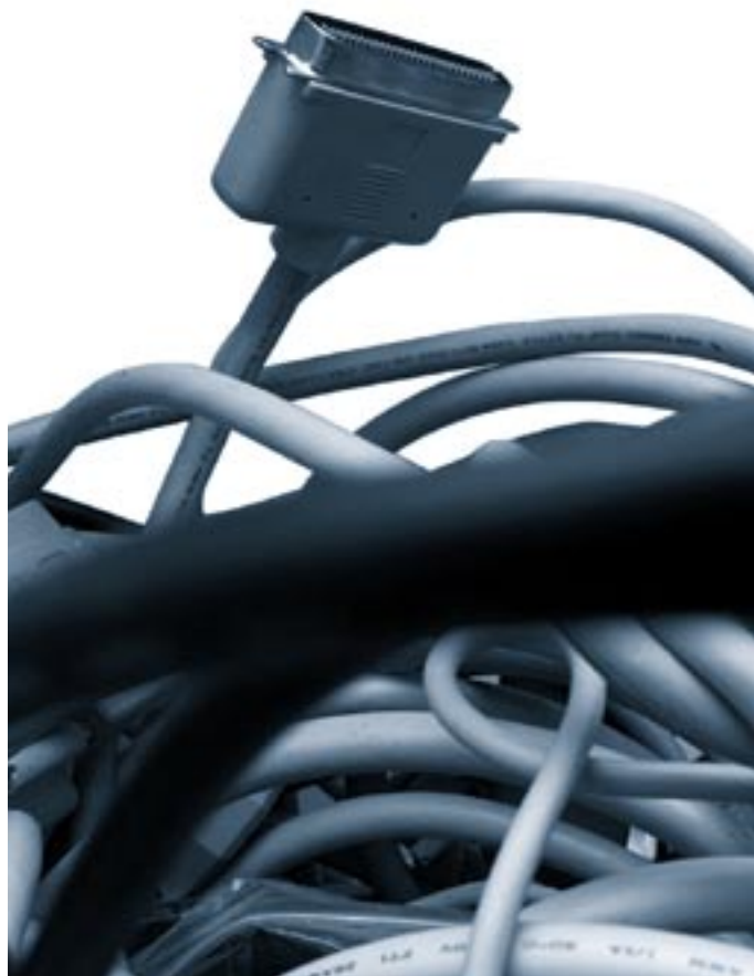
Vers une transformation radicale des rapports sociaux?

Ces évolutions ont donc «des répercussions sur le mode de