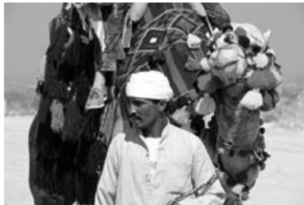
Le patrimoine: matériel et immatériel.