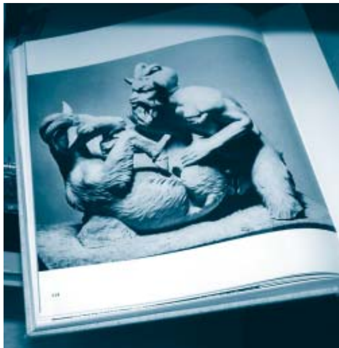
«Satyre copulant avec une chèvre», illustration extraite d'un ouvrage consacré au Cabinet secret du Musée national de Naples, un des ouvrages conservés aux «enfers» de la BCU.

Diverses motivations ont présidé à la mise sous cloche de ces ouvrages, qui, «même si l'on ne comprend pas toujours les rai-