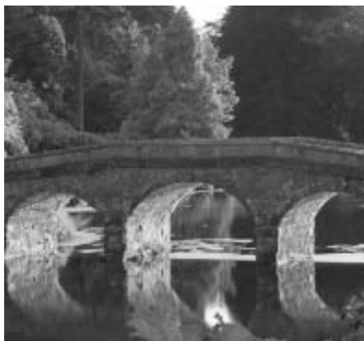
L'Europe jette des ponts entre ses chercheurs. Encore faut-il les trouver.

des programmes cadres. En outre, Swisscore , antenne commune d'Euresearch, de l'OFES et du Fond national, est installée à Bruxelles. Elle se trouve ainsi au cœur des centres de décisions européens et est ainsi à même de fournir à Euresearch une information sur les derniers développements de cette Europe de la recherche en plein essor. Ces informations