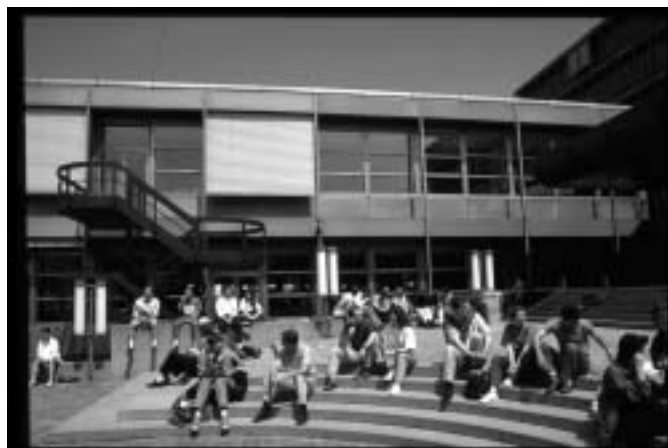
Se dorner au soleil ou s'engager ? A l'Unil, il y a un temps pour tout...

Malgré cette activité, l'enquête de la Junior Entreprise laisse ressortir que la connaissance de la FAE est relativement faible: Si 83% des étudiants disent connaître l'existence de la fédération, ils ne sont que 29% à pouvoir citer une ou plusieurs actions entreprises par celle-ci ces dernières années. Par ailleurs, 75% des sondés ignorent que la FAE distribue 60 000 francs de subventions par année: théâtre, colloques, radios, revues d'étudiants sont pour la plupart subventionnés au moins en partie par la FAE. C'est d'ailleurs une de ses missions: