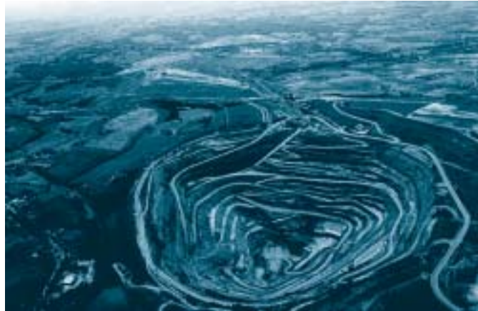
L'activité minière nuit aux ressources en eau

Ensuite, le minerai est extrait. Dans le cas de l'or par exemple, il est intéressant d'exploiter un gisement s'il contient entre 5 à 10 grammes de métal par tonne. Il faut ensuite extraire la matière précieuse à l'aide de différents procédés gourmands en énergie, mais ce n'est pas le plus grave. Dans les cavités créées par les mines, des lacs se forment, qui