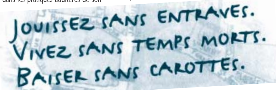
Slogan de Mai 68, Nanterre.

Le passage d'une société théocratique à une société démocratique libérale marque un effacement du sacré, de l'interdit, au profit de liens sociaux où ne compte plus que la sanction de la réussite ou de l'échec. Les critères de performance ont