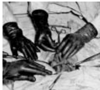
des gestes à apprendre...

cins peuvent se passer de stage dans un service jusqu'en 5e année, et rien n'oblige un mordu de chirurgie à se frotter à la psychiatrie, même si dans les faits, les jeunes médecins savent qu'il est préférable de passer dans plusieurs services. Mais, précise le professeur Bosman, «dès lors que les objectifs sont clairement fixés, les étudiants se rendront bien compte qu'ils doivent passer partout s'ils entendent réussir leurs examens». Outre les stages de 5e année, un semestre de la 4e sera consacré à des cours-blocs avec approche pratique, un semestre de la 6e sera également consacré au «terrain». Deux ans de stages au total, pendant lesquels les étudiants seront