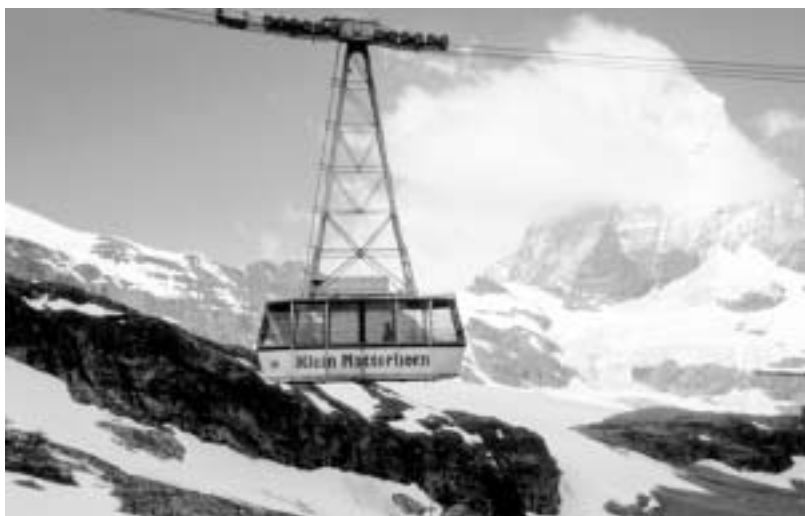
Téléphérique du «Petit Cervin» à Zermatt

Depuis sa fondation, l'association organise des cycles de conféren-