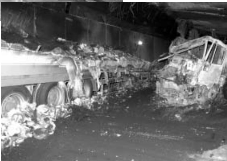
Drame du Gothard: les deux véhicules dont le choc a embrasé le tunnel pendant 36 heures. Photographies réalisées par les assistants du département Incendies et explosions lors de l'expertise.

Les investigations ont duré plusieurs jours, pendant lesquels les experts se sont efforcés de reconstituer l'origine et les causes de l'incendie, à la fois par l'observation du site, l'examen des véhicules impliqués dans la collision et par l'ana-