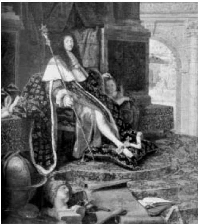
Henri Testelin, Portrait de Louis XIV, protecteur des arts , 1668

Gérard Sabatier propose une lecture politique de Versailles, sa signification, sa fonction. L'art intervient comme une stratégie de pouvoir, dans laquelle le politique s'exprime par l'allégorie. Basée sur l'observation d'un art de commande, l'idée fondamentale est que les tenants du pouvoir ont développé un programme iconographique commun reflétant leurs idées politiques.