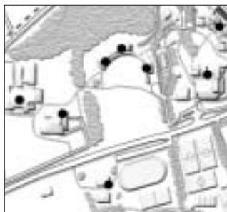
Les bornes informatiques à Dorigny

Le serveur central héberge près de 164 sites, et reçoit près de 8'000'000 de "hits" par mois (ouverture d'une page hébergée à l'UNIL). 144'000 personnes surfent mensuellement sur les sites hébergés.