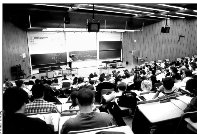
Un professeur, minuscule îlot au centre d'une mer d'étudiants.

La définition du terme "taux d'encadrement" n'est pas sans poser quelques problèmes. En effet, le ratio étudiants/enseignants n'est qu'une estimation du taux effectif d'encadrement. La définition de ce ratio est donnée par l'ensemble des étudiants divisé par le total des enseignants, assistants, et le programme de relève de la Confédération, les membres de ces trois groupes dépendant uniquement du budget UNIL. Le ratio est donc