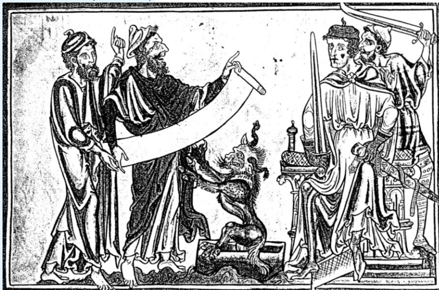
L'antéchrist, représenté ici sous des traits humains, écoute, assis sur son trône, les prêches d'Hénoch et Elie, envoyés par Dieu pour s'opposer à lui. Bibliothèque nationale de France, Paris.