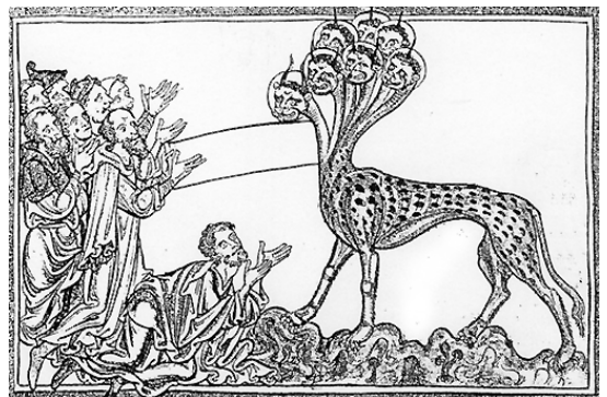
L'Antéchrist, sous les traits de la bête aux sept têtes, triomphe.