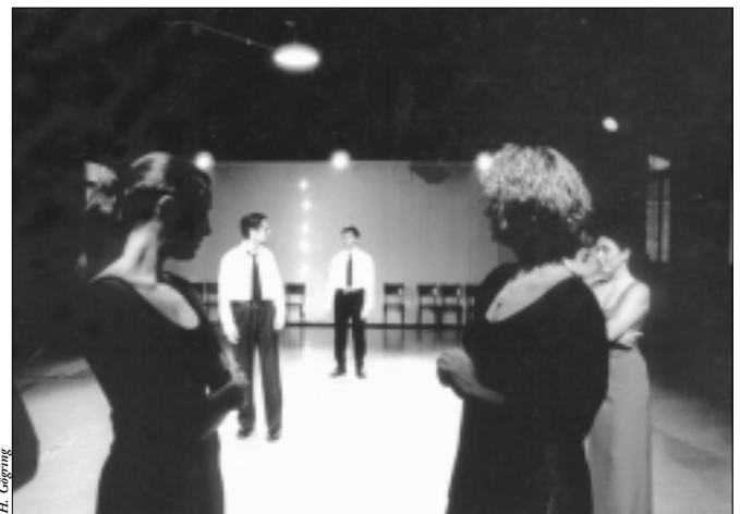
Le Mensonge, par la Compagnie Le Crochet à Nuages