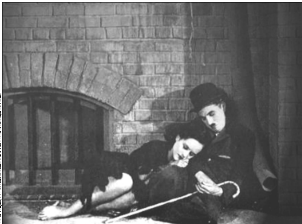
Charlie Chaplin, l'un des cinéastes étudiés à la section histoire et esthétique du cinéma