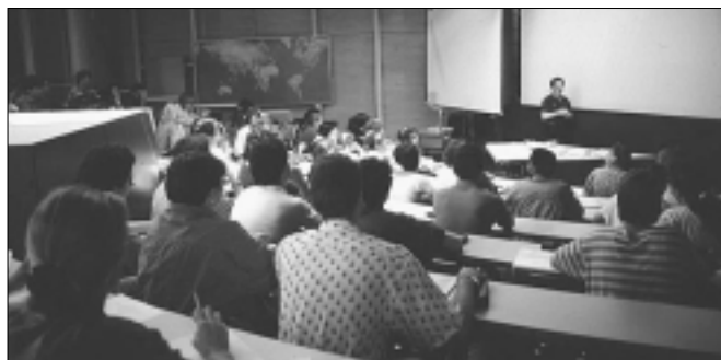
La dialogue professeurs-étudiants est une des clés de l'évaluation

Recherche et enseignement sont les principales tâches auxquelles sont confrontés les professeurs de l'UNIL. Cependant, chacun de ces aspects a son importance, et il ne serait pas judicieux de porter son attention plus spécialement sur l'un que sur