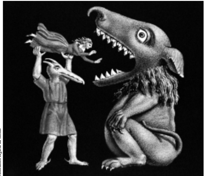
Association Regard du monde