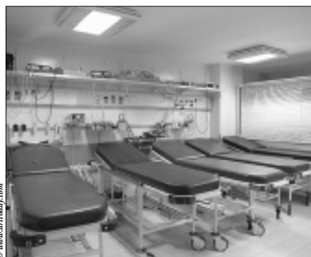
Certains patients repartent avant la fin de leur traitement. Cela soulève des problèmes d'éthique.

Chômeurs en fin de droit, réfugiés, requérants d'asile, toxicomanes, alcooliques, personnes âgées démunies ou inadaptés sociaux, de nombreux membres de notre société souffrent de vivre dans des conditions pénibles. Comme tout le monde, ces personnes ont besoin de soins hospitaliers. Par ailleurs, les contraintes budgétaires croissantes, soulèvent la question de la priorité des moyens alloués pour la prise en charge médicale de ces patients socialement fragilisés. Le monde médical doit ainsi s'interroger sur son rôle. Les divers problèmes de santé, chroniques ou par-