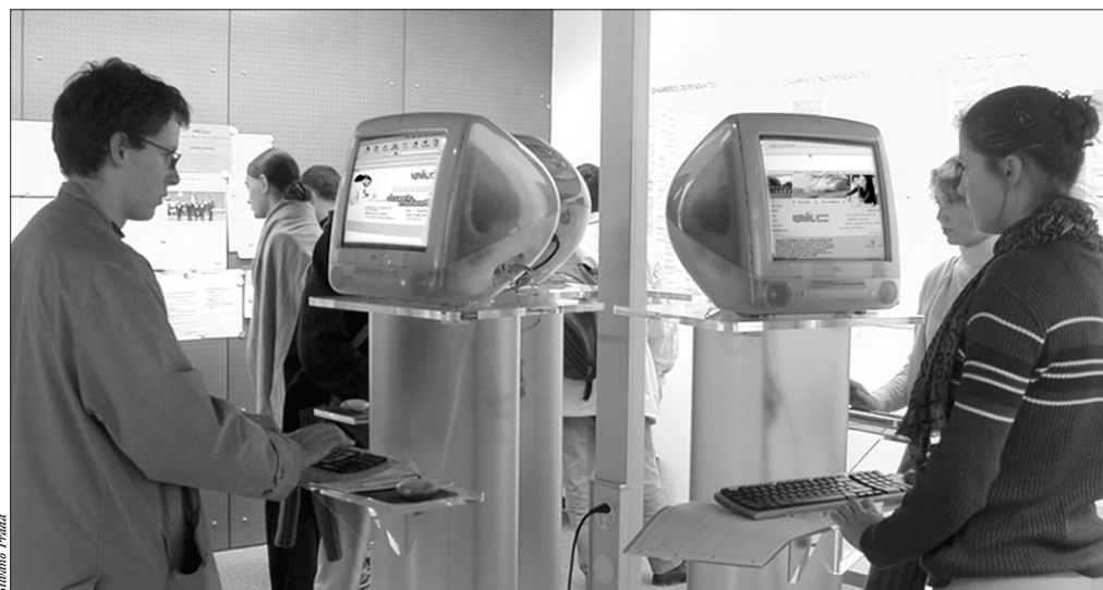
Les bornes Internet sont à disposition de tous les étudiants de l'UNIL. On en trouve pour l'instant à l'École de Médecine, au Service des affaires socio-culturelles et à la Banane.