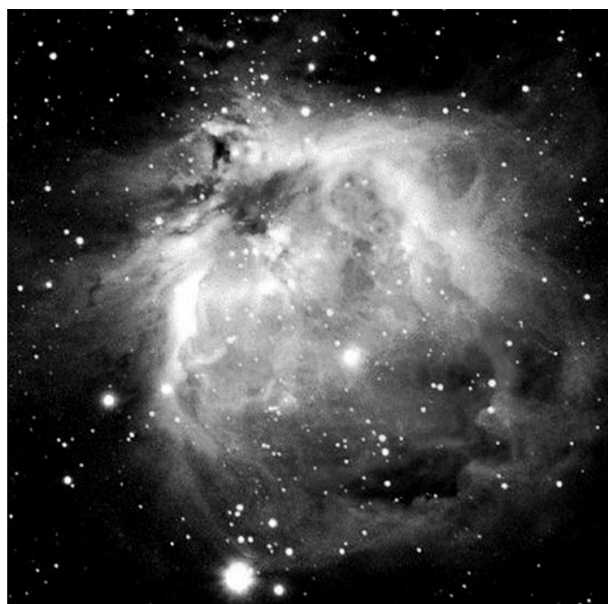
La nébuleuse d'Orion