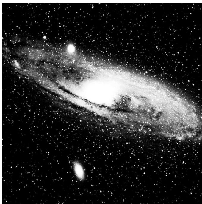
La galaxie d'Andromède

D'autres projets sont également à l'étude: l'élaboration et la soumission à l'Observa-