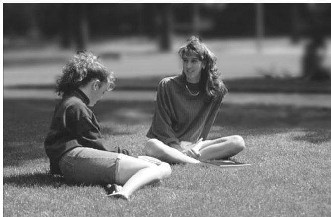
TANDEM, un moyen sympathique et facile de développer ses connaissances dans la langue et la culture d'autrui.

De nombreuses personnes ont des notions, rudimentaires ou étendues dans des langues autres que leur langue maternelle. Acquise par différents moyens, séjours à l'étranger ou cours quelconques, la maîtrise obtenue est souvent perdue au fil du temps. TANDEM est donc un excellent moyen de remettre à niveau des connaissances.