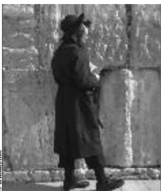
Juif devant le mur des lamentations.

Avant la Réforme, la situation des Juifs en Europe a connu des fortunes diverses. Leur statut variait en fonction de l'endroit, du moment, des relations avec