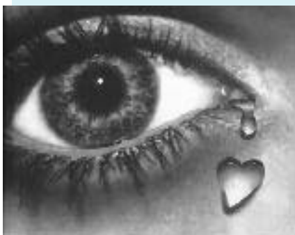
Photo tirée du magazine «Qvo» no 27, janvier 1999.