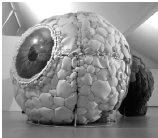
L'œil, l'une des sculptures géantes de Jan Niedojo