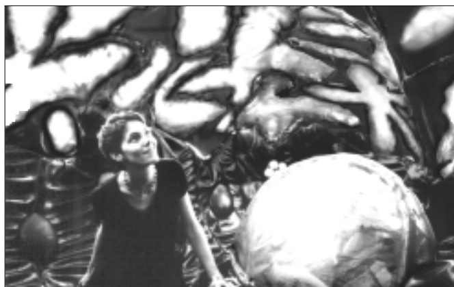
Le cerveau façon Jan Niedojo, vu de l'intérieur

Organes propose également un parcours historique et symbolique autour des représentations du corps. Images de la Renaissance, - avec notamment les magnifiques gravures de Vesale-, côtoient une œuvre récente du Suisse Franticek Klossner: le corps réinventé à partir de l'imagerie médicale. De la reconstitution virtuelle du corps, le Visible Human Project , en passant par un ex-voto étrusque du IIe siècle av. J.-C., composé d'un utérus avec un ovaire, c'est à la fois le corps-symbole, le corps-transparence ou le corps-machine qui sont représentés, mais aussi tout simplement le corps-chair, car «de corps et ses organes sont sans cesse refaçonnés par l'art, la culture, les sciences et les techniques. Au point parfois