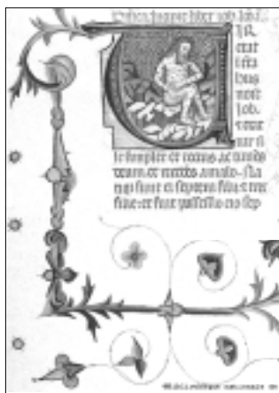
Enluminure de Job atteint par la lèpre

début le cycle de conférence en interrogeant un personnage biblique qu'elle connaît bien: Job. Personnage pieux, d'un statut social élevé, ce personnage s'est vu éprouvé par Dieu qui l'a privé de ses possessions. Ses richesses parties, sa famille anéantie, affligé par la maladie,