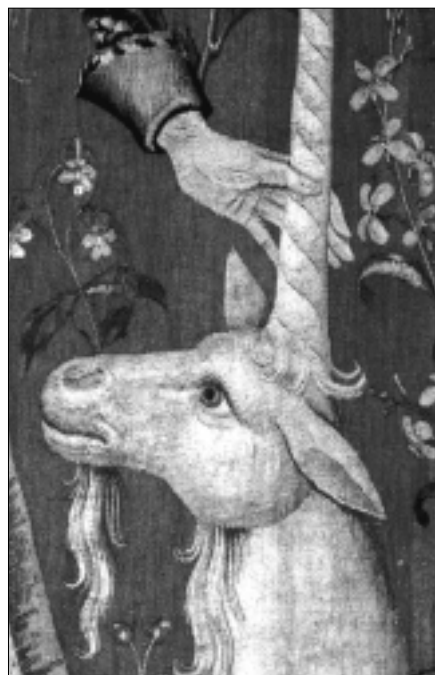
La tapisserie médiévale en six tableaux intitulée, «La dame à la licorne» (musée de Cluny), est une illustration des sens. Ici un extrait: le toucher

Les sens jouent également un rôle dans la vie sociale de l'homme médiéval. Un exemple: le baiser sur la bouche. S'il est considéré de nos jours comme un échange amoureux, au Moyen Age il en est autrement. Selon Yannick Carré – auteur de: Le baiser sur la bouche au Moyen Age , qui sera présent lors du colloque – il a un aspect rituel important. A la fois affectueux – on s'embrasse sur la bouche entre amis –, liturgique, amoureux ou contractuel, le baiser sur la